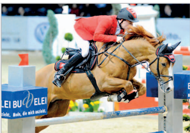
Světlý ryzák 5171 Lord Weingard (nar. 2001, po Lordanos) je nejnovější a nedražší akvizicí ZH Tlumačov. Reprezentant oldenburského plemene německého chovu z hřebčína Sprehe je mimořádně úspěšným koněm podle sportovních i chovatelských výsledků. U nás připouští za 8000 Kč, ale členové Svazu chovatelů českého teplokrevníka mají slevu 50 %

ho, Olomoucký, Gottwaldovský a Ostravský) a čtyř obvodních zootechniků. Plemenářská služba zajišťovala evidenci plemenných klisen, výkonostní zkoušky v zemském chovu, přehlídky potomstva, výstavy koní, zápisy do krajských plemenných knih klisen, revize zapsaných klisen a návrhy klisen do státní plemenné knihy. Tato osnova pracovní náplně zootechniků, později konzultantů a nově inspektorů chovu koní, zůstává zachována dodnes. V roce 1960 byla plemenářská služba delimitována od SPÚ Tlumačov ke krajským plemenářským správám nově zřízených krajů, a to Jiho-